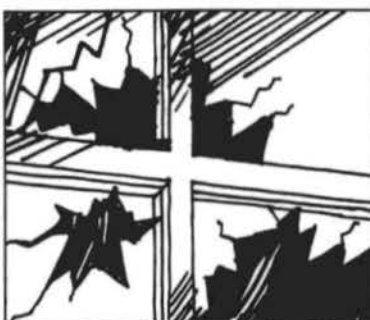
Não quebre vidraças de locais públicos.