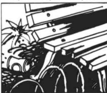
Não destrua as praças.