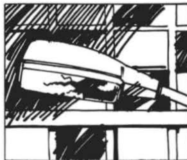
Não deprede a iluminação pública.