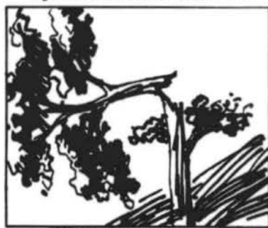
Não arrebite as árvores.