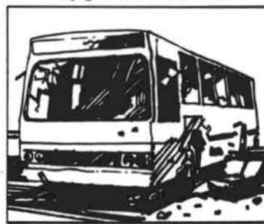
Ajude a conservar os meios de transporte.