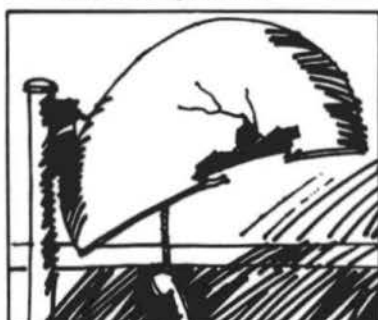
Ajude a conservar os "orelhões".