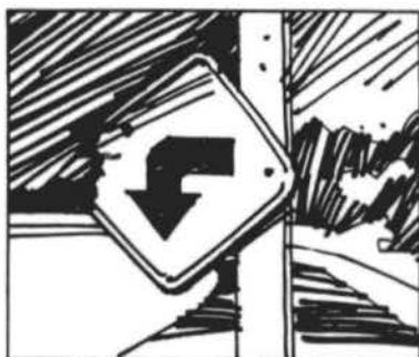
Não destrua placas de trânsito.