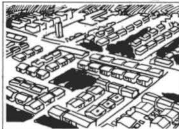
PROSINDI Programa de Habitação para o Trabalhador Sindicalizado.