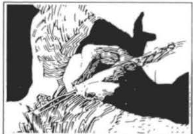
PNDA Programa Nacional de Desenvolvimento do Artesanato.