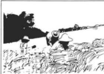
SENAR Serviço Nacional de Formação Profissional Rural