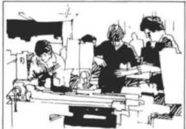
SNFMO Sistema Nacional de Formação de Mão-de-Obra.

“ Mas é sobretudo no campo social, acima de tudo nos investimentos feitos no homem e para seu bem-estar, que verdadeiramente realizaremos a independência nacional. Por assim julgar, desejo deixar bem claro que o pensamento e a ação do meu governo não se realizam só nas construções, nas obras e nos edifícios, nas fábricas e nas máquinas, nas usinas e nos geradores.